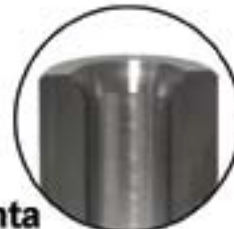
ID / OD / Faceamento